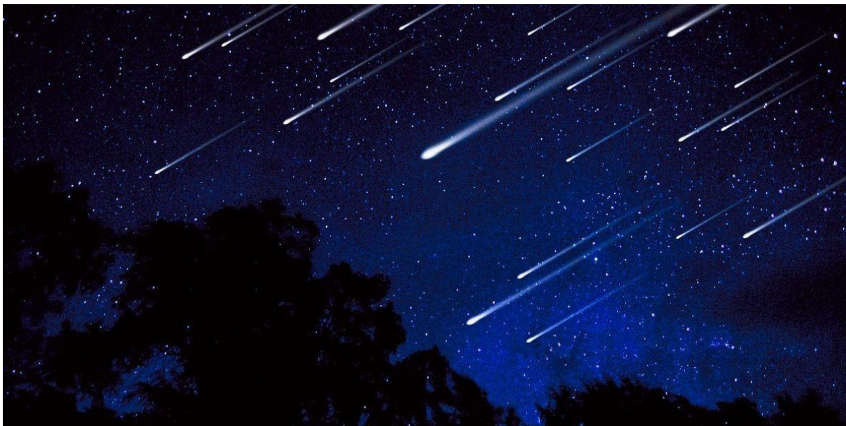
Abbildung 2- Perseiden

Die «Stars» des Monats sind die Perseiden. Sie zeigen sich Mitte des Monats in einer Vielzahl mit bis zu 100 (!) Sternschnuppen pro Stunde. Bedeutet, dass es viel Potential gibt, alle möglichen Wünsche zu erfüllen. Unter den Perseiden flammen auch sogenannte Boliden oder Feuerkugeln.