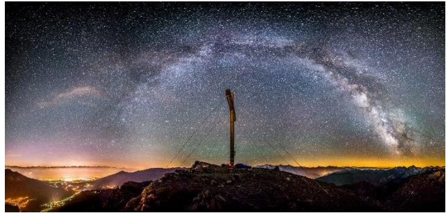
Abbildung 3- Milchstrasse

Die dunkle Jahreszeit beginnt, der helle Tag wird von ca. 11 Stunden am Monatsanfang bis knapp 10 Stunden am Monatsende kürzer. Der Steinbock ist am Südhimmel zu sehen und in der Nacht dominiert immer noch das mächtige Sommerdreieck im Südwesten und das Pegasus Viereck im Süden. Gegen Morgen strahlen Sterne wie der Orion oder Sirius.