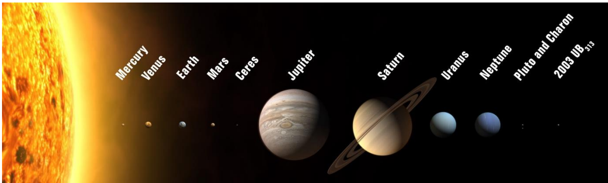
Abbildung 7- Planeten