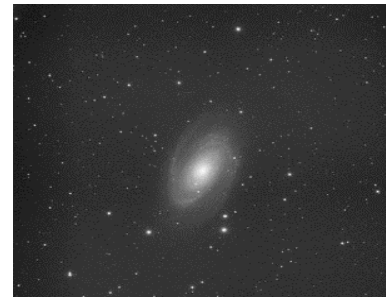
Abbildung 4- Bodes Galaxie

Die M81 ist eine Spiralgalaxie und im Sternbild Grosser Bär am Nordsternhimmel zu finden. Sie ist ca. 12 Millionen Lichtjahre entfernt und besitzt einen Durchmesser von 82'000 Lichtjahren. Sie enthält schätzungsweise 200 Milliarden Sterne und ihr zentrales Schwarzes Loch hat eine Masse von rund 70 Millionen Sonnenmassen (etwa 15-mal massereicher als das Schwarze Loch im Zentrum unserer Galaxie).