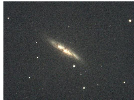
Abbildung 5- M82

Die M82 ist gravitativ an M81 gebunden und befindet sich ebenfalls im Sternbild Grosser Bär. Durch Wechselwirkungen bei einem nahen Vorbeiflug, vor etwa 500 Millionen Jahren, an der M81 wurde die M82 dramatisch verändert. Im inneren Bereich hat sich die Rate, mit der neue Sterne aus interstellarer Materie entstehen, stark erhöht (Starburst). Dadurch ist M82 eine der hellsten Infrarotgalaxien und eine der hellsten Galaxien im Radiobereich.