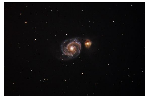
Abbildung 6- Whirlpool Galaxie

Die M51 ist eine grosse Spiralgalaxie welche die Spiralstruktur stark ausprägt. Die 25 Millionen Lichtjahre entfernte M51 liegt im Sternbild Jagdhunde. Die Galaxie hat eine aktive Sternentstehung und viele junge, massenreiche und vergleichsweise kurzlebige Sterne. Ihr galaktischer Kern ist aktiv und im Zentrum liegt ein supermassenreiches Schwarzes Loch. Die M51 besitzt eine Begleitgalaxie welche sehr wechselwirkend und irregulär erscheint.