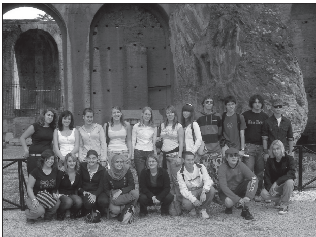
Die Klasse 3MSa mit einigen Freunden der Schweizerschule im Forum Romanum.